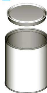
С ПРИЖИМНОЙ КРЫШКОЙ