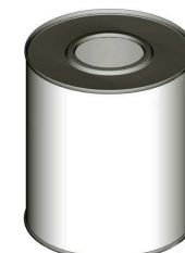
С ВЕРХНИМ ЗАКАТАННЫМ ДНОМ ПОД ПЛАСТИКОВУЮ ВСТАВКУ